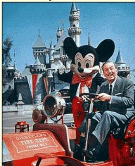
ವಾಲ್ಟ್ ಡಿಸ್ನಿಯೊಂದಿಗೆ ಮಿಕ್ಕಿ

ಪ್ರಾರಂಭದ ದಿನಗಳಲ್ಲಿ ಮಿಕ್ಕಿಮೌಸ್‌ಗೆ ಧ್ವನಿ ನೀಡುತ್ತಿದ್ದದ್ದು ವಾಲ್ಟ್ ಡಿಸ್ನಿಯೇ. ನಂತರ ಈ ಅವಕಾಶ ಜಿಮ್ ಮೆಕ್‌ಡೊನಾಲ್ಡ್ (1946ರಿಂದ 1974ರವರೆಗೆ) ಹಾಗೂ 1974ರಿಂದ ಮುಂದಕ್ಕೆ ವೇಯ್ಸ್ ಆಲ್‌ಬ್ರೈಟ್‌ರಿಗೆ ಲಭಿಸಿತು. ಪತ್ರಿಕೆಗಳಲ್ಲಿ ಮಿಕ್ಕಿಯ ಮೊದಲ ಕಾರ್ಟೂನ್ "ಲಾಸ್ಟ್ ಆನ್ ಎ ಡೆಸೆರ್ಟ್ ಐಲೆಂಡ್" 1930ರಲ್ಲಿ ಪ್ರಕಟವಾಯಿತು. ಉಬ್ ಇವರ್ಕ್ಸ್ ಚಿತ್ರಿಸುತ್ತಿದ್ದ ಈ ಸರಣಿಯ ಮೊದಲ ಕಥೆಗಾರರಾಗಿದ್ದದ್ದು ವಾಲ್ಟ್ ಡಿಸ್ನಿಯೇ ಆದರೂ ಕೆಲದಿನಗಳಲ್ಲೇ ಈ ಜವಾಬ್ದಾರಿಯನ್ನು ಫ್ಲಾಯ್ಡ್ ಗಾಟ್‌ಫ್ರೆಡ್‌ಸನ್ ವಹಿಸಿಕೊಂಡರು. ಶೀಘ್ರದಲ್ಲೇ ಮಿಕ್ಕಿ ಪಾತ್ರವಹಿಸಿದ್ದ ಟಿ ವಿ ಕಾರ್ಯಕ್ರಮಗಳೂ ಪ್ರಾರಂಭವಾದವು - ಮಿಕ್ಕಿಯ ಜನಪ್ರಿಯತೆ ಹೆಚ್ಚುತ್ತಲೇ ಹೋಯಿತು.